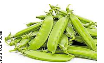
Schmecken blanchiert und in Butter geschwenkt: Zuckerschoten

Gesund sind sie außerdem. Wegen ihres hohen Protein-Anteils haben sie einen positiven Effekt